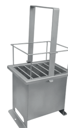
support bidon cadenassable